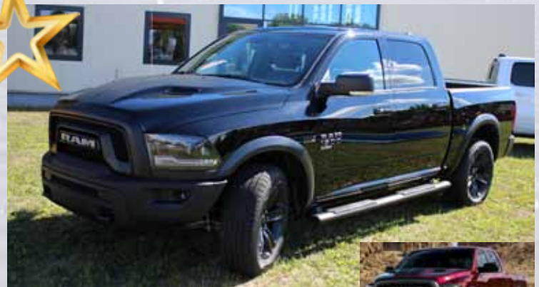
in Delmonico Red oder in Grau-schwarz

inkl. Prins 2.0 LPG Gasanlage mit 122 L Unterflurtank Anhängerkupplung bis 3.500 kg, Unterbodenschutz u. Hohlraumversiegelung Verzollung u. Umbau/Homologation StVZO 24 Monate Garantie bis 100.000 km