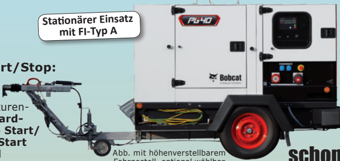
Abb. mit höhenverstellbarem Fahrgestell, optional wählbar