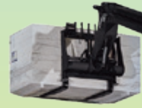
Lastdiagramm, Palettengabel, voll abgestützt