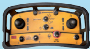
ferngesteuerte Bedienung inkl. Fernsteuerung

Standardmäßig integrierte zentrale Huböse zum schnellen und sicheren Heben im Transport oder Grabeneinsatz